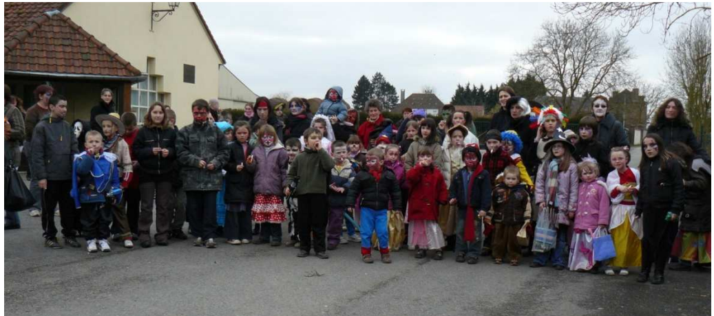
Le groupe avant le départ

Pour la seconde année, le Comité des fêtes proposera aux enfants de passer une agréable après-midi de Mardi-Gras déguisés et maquillés. En plus, ce sera les vacances !