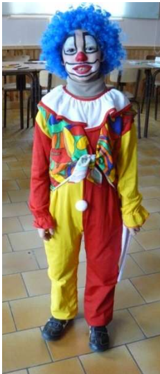
Theophraste, février 2009.