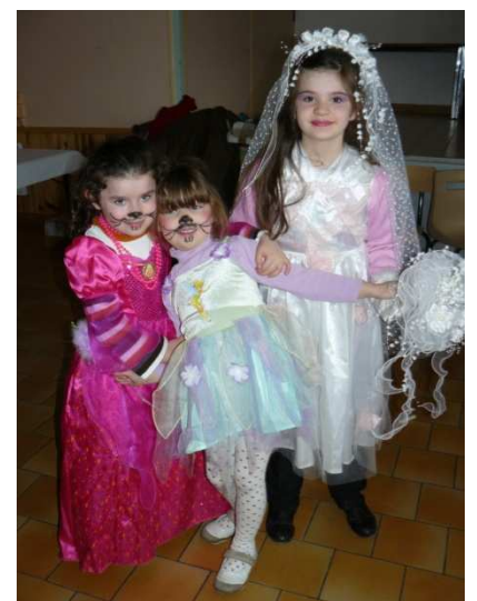
De biens jolis déguisements !