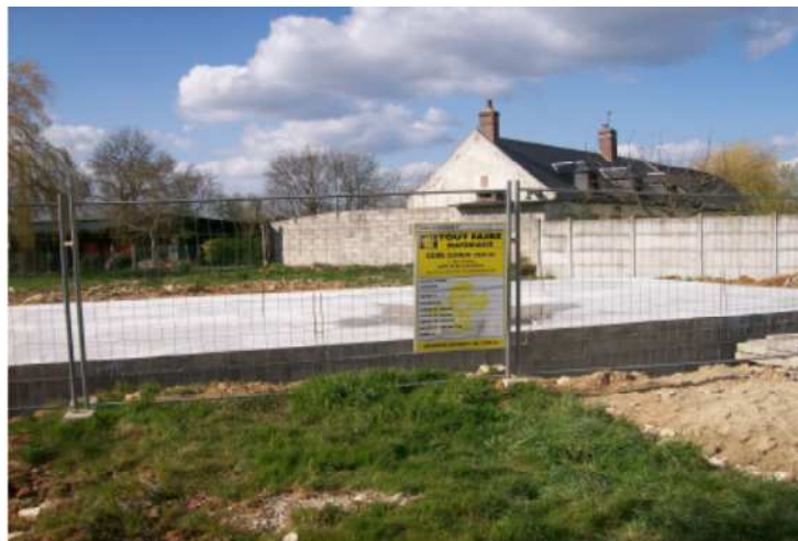
Que de changements depuis avril 2008!

La divagation des chiens est interdite dans la commune