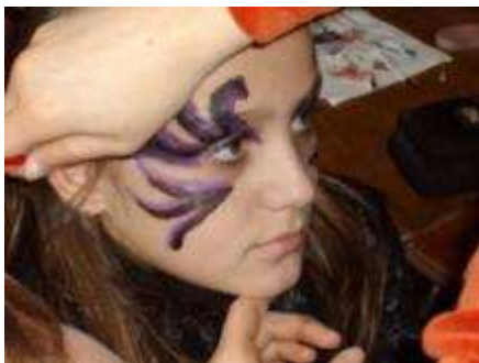
De jolis maquillages et déguisements!