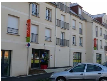
Bulletin municipal de Cormeilles n 4 janvier 2009