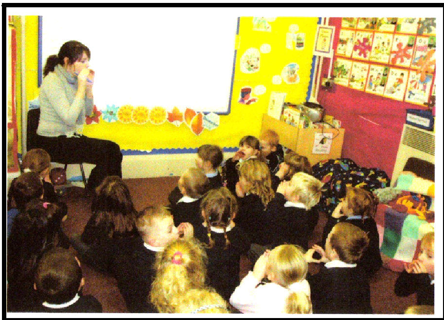
L'uniforme à l'école a pour but d'effacer les différences sociales...

En France, nous apprenons deux graphies différentes (scripte et cursive). En Angleterre, les élèves commencent l'apprentissage de la lecture dès 4 ans et de façon phonétique; par contre l'apprentissage de l'écriture cursive leur semble très difficile (et peu utile) et ne débute que beaucoup plus tard. C'est plus facile.