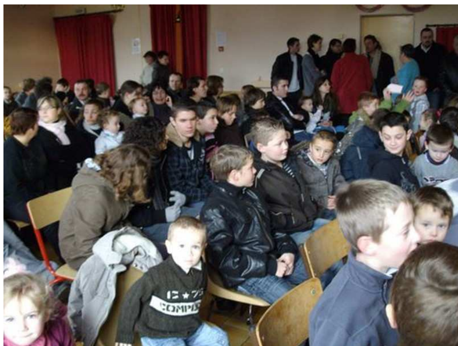
Une salle bien remplie attend le Père Noël!

Le Comité des fêtes a offert un spectacle de magie et la mairie a aidé le Père Noël pour les cadeaux.